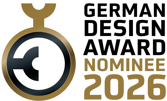
German Design Award 2026 Nominee

The German Design Awards label may only be used in connection with the awarded design achievement. It makes the success of your design visible in a unique way. Please always use the original label provided by the German Design Council.