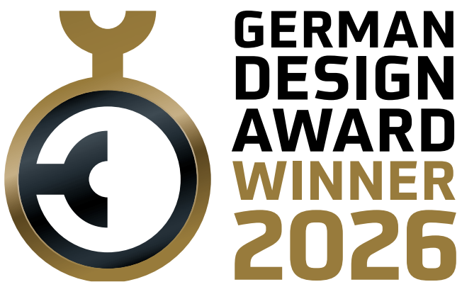
German Design Award 2026 Winner