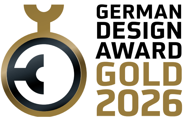
German Design Award 2026 Gold